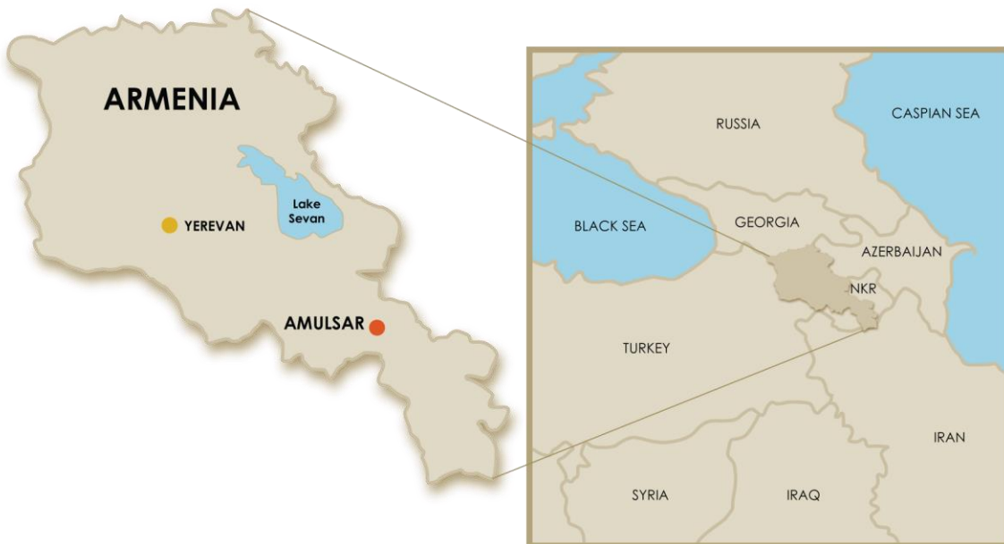
Քարտեզ 4.1.Նախագծի գտնվելու վայրը

Ինչպես երևում է Քարտեզ 4.1-ից, Ամուլսար նախագիծը գտնվում է Հայաստանի մայրաքաղաք Երևանից 170կմ դեպի հարավ, Վայոց Ձոր և Սյունիք մարզերի սահմանագծի վրա: Ամուլսարի արտոնագրերը ընդգրկում են ընդհանուր առմամբ 65կմ 2 տարածք: Լիդիան ընկերությունը, երկրաբանական հետախուզության աշխատանքներ է իրականացրել Հայաստանում, Ամուլսարի տարածքում սկսած 2006թ.: 17